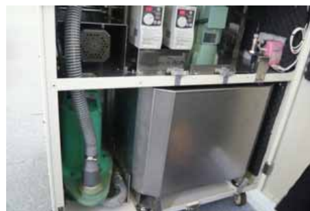
溶解式紙処理機の内部（左下がポンプ）

最初に相談があってから幾度にもわたり試作と改良を繰り返してきたが、なんと6か月後には改良機が完成した。マックのなんとか顧客サービスを向上させたいという気持ちと、ジャポンのスピーディーな対応が短期間での完成につながった。迅速な顧客対応と技術の融合によって生みだされた特別仕様の本製品。ゴールド・エコテック同士のハイレベルな共同開発による改良型溶解式紙処理機がみなさんのオフィスで活躍する日が近いかもしれない。